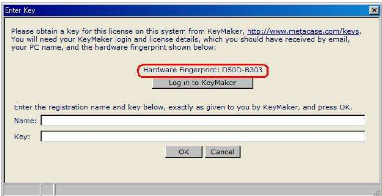
図 6 : Hardware Fingerprint の取得

図 4 もしくは図 5 のログイン画面で、“pcName” にコンピュータ名、“hardwareFingerprint” に図 5 の HardwareFingerprint の値を入力し、Process Keys ボタンをクリックします。