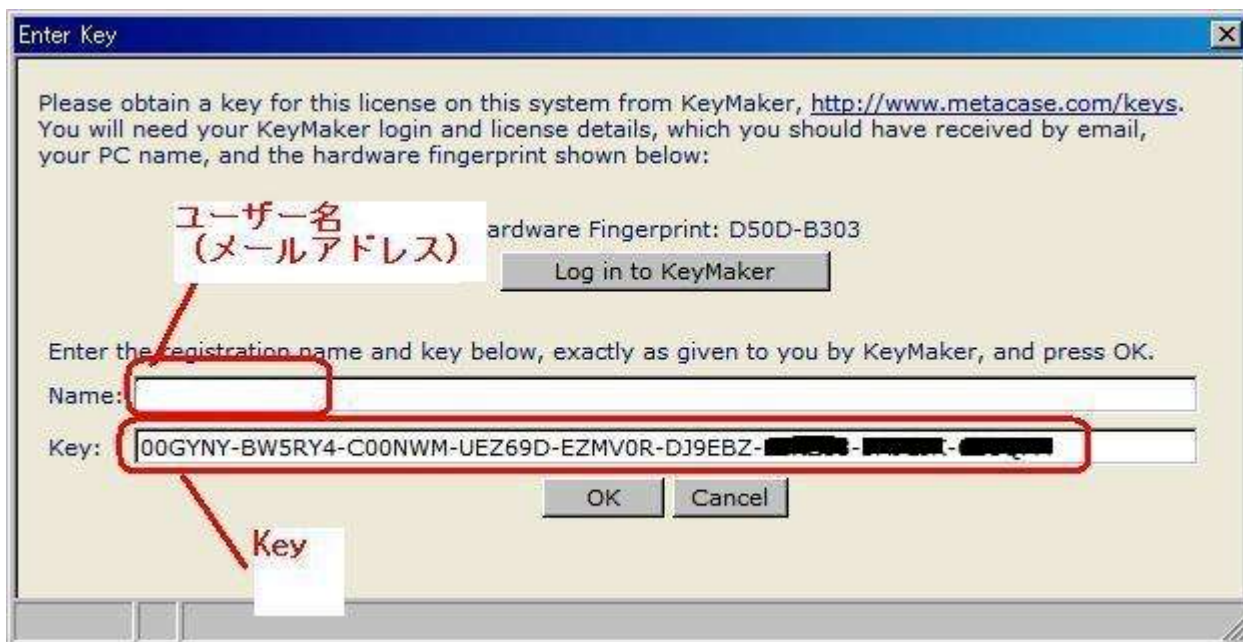
図 7 : ユーザ名と Key の入力

この Name と Key を図 6 のダイアログの “Name” と “Key” に入力し、OK ボタンをクリックします。